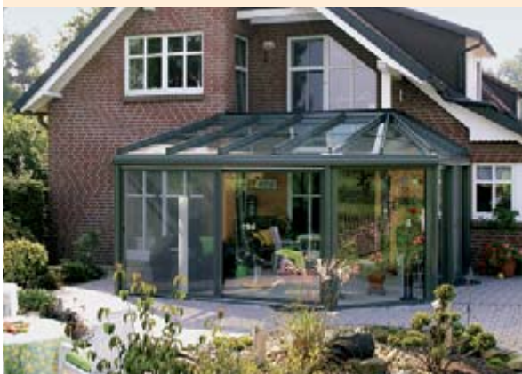
▲ weinor Wintergärten

Wie auch immer Sie Ihre Terrasse nutzen möchten, weinor hat das geeignete Produkt für Sie – Markisen, Terrassendächer und Wintergärten