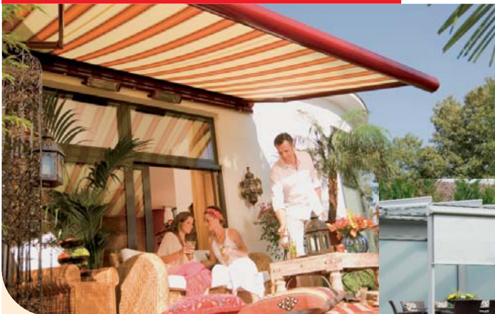
▲ weinor Markisen